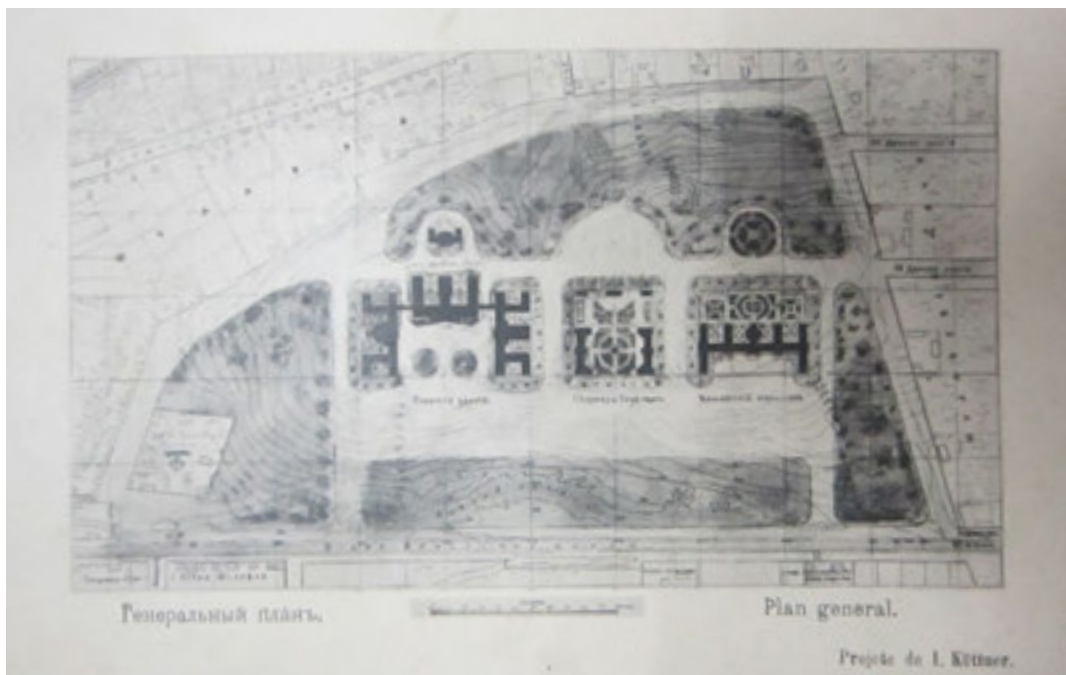
Рис. 1. Оригінальний план Політехнічного інституту (арх. І.С. Кітнер, 1897)

Незважаючи на те, що на момент створення головні корпуси обох університетів будувались на території різних країн і відрізнялись за функціональним призначенням, вони мають спільні ознаки, головним чином у стилістичних і архітектурно-планувальних рішеннях. Отже, як