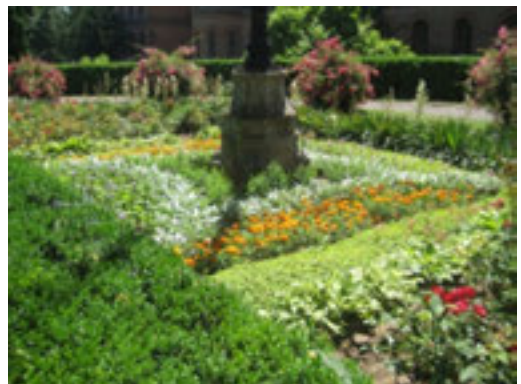
Рис. 4. Набірно-орнаментальний партер (фото 2014 р.)

боків збережено дугоподібні доріжки. Таким чином, на території кожного з цих дворів є три композиційні вісі, які спрямовують відвідувачів до головних входів домініант – навчальних корпусів. Варто зауважити, що на фасадній лінії навчального корпусу № 4 є ще один двір, утворений у результаті прибудови частини будівлі в 1920–1930 рр., проте його територія виконує функції автопарковки, що пояснює спрощеність структури.