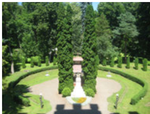
Рис. 7. Пам'ятник Й. Главці (фото 2014 р.)

Садово-паркове обладнання загального користування на обох територіях відповідає загальній композиції та стилістично