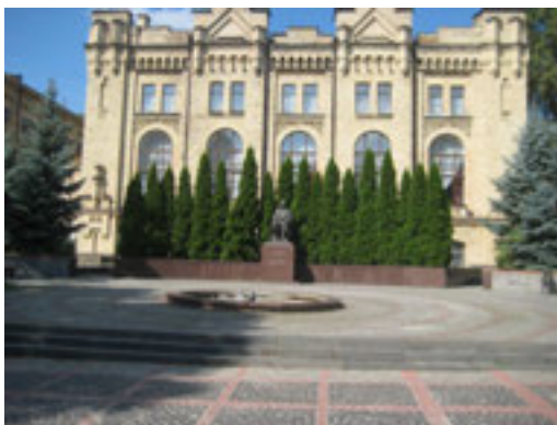
Рис. 5. Пам'ятник Є.О. Патону (фото 2014 р.)

Слід зауважити, що монументальні споруди на досліджених територіях є тематичними елементами, образно та ідейно пов'язаними з історією та профілем університетів. Так, на території НТУУ «КПІ» встановлено пам'ятники видатним вченим, які зробили значний внесок у розвиток науково-дослідної діяльності університету упродовж його існування та науки в цілому: В.Л. Кирпичову, С.П. Корольову, Л.В. Люльєву, В.М. Челомею та ін. Більшість пам'ятників однотипні – на вимощених червоними полірованими гранітними плитами майданчиках встановлено погруддя діячів науки. Однак від них відрізняються пам'ятник Є.О. Патону, встановлений на тильній стороні навчального корпусу №1 і, через перепад рельєфу, вмонтований у гра-