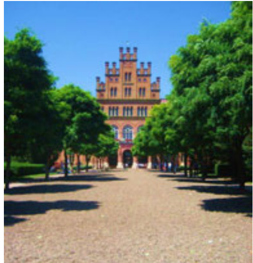
Рис. 3. Головна алея на території ЧНУ ім. Юрія Федьковича (фото 2014 р.)

Двори-курдонери перед навчальними корпусами № 1 та 4 НТУУ "КПІ" до другої половини ХХ ст. мали спрощену планувальну структуру – через всю їх територію пролягало по одній дугоподібній доріжці. Нині ж по центру прокладено алеї, перпендикулярні до головної дороги, що відокремлює кампус від парку, а з двох