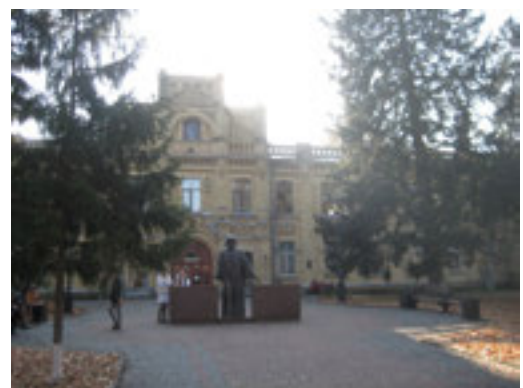
Рис. 6. Постамент Д.І. Менделєєву (фото 2014 р.)