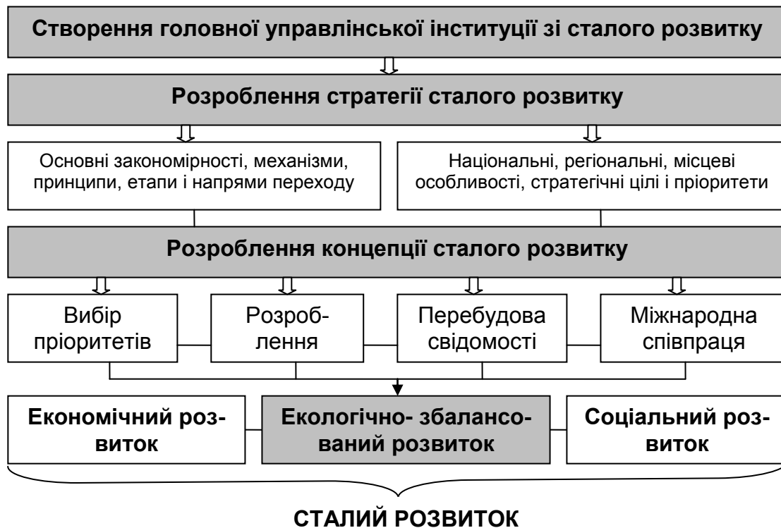
Рис. 1. Концептуальна модель впровадження сталого розвитку

безпечення. Нині у багатьох розвинених країнах світу сформовано засади збалансованого розвитку суспільства і створено відповідні органи за прикладом Комісії зі сталого розвитку Організації Об'єднаних Націй (ООН), завданням яких є інституційна підтримка процесу (див. таблицю) [5].