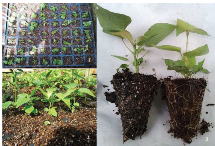
Рис. 3. Адаптація Populus tremula L. в умовах теплиці:

1 – дорощування (1-й день адаптації); 2 – 2-й тиждень після адаптації; 3 – адаптований садивний матеріал осики (3-й тиждень в умовах теплиці)