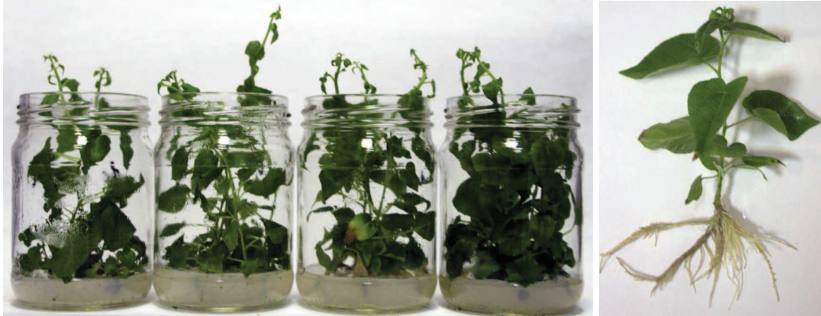
Рис. 1. Сформовані рослини-регенеранти P. tremula перед адаптацією

У своїх дослідженнях з осикою М. А. Іванова [4, 5, 6], проводила обрізування коріння рослин-регенерантів перед адаптацією, що супроводжувалося низьким виживанням. На відмінну від цього, ми залишали кореневу систему рослин у сформованому стані, середня довжина коріння перед адаптацією РР становила 7,7 \pm 2,3 см, середня кількість коренів 5,4 \pm 0,2 шт., що дало змогу отримати набагато кращі результати приживлення рослин осики до умов ex vitro (рис. 1).