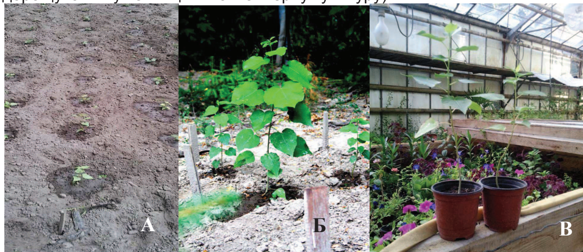
Рис. 4. Адаповані рослини Populus tremula L. отримані in vitro :

Адаповані рослини, що досягли висоти 10–15 см, переносили на розсадник (рис. 4, А, Б.). Менші за розміром рослини залишали на дорощування у теплиці як контейнерну культуру).